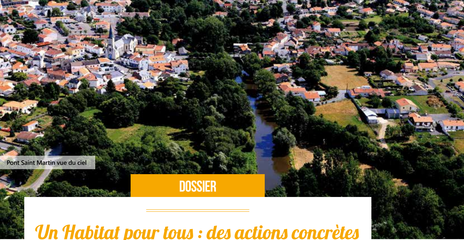
Pont Saint Martin vue du ciel