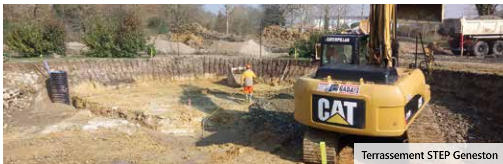
Terrassement STEP Geneston

2018 a été marquée par les travaux d'extension de la station d'épuration de Geneston, dont la capacité est passée de 3 000 E.H. (Equivalent-Habitant) à 5 200 E.H. ainsi que des travaux de réhabilitation des réseaux. En 2019, les travaux d'extension du réseau sur La Chevrolière (rue des Landes de Tréjet, le Fablou, la Landaiserie) et Saint Philbert de Grand Lieu (Les Guittières) sont prévus ainsi que des réhabilitations de réseaux à Saint Philbert de Grand Lieu (Courtils) et à Pont Saint Martin (rue du Pays de Retz).