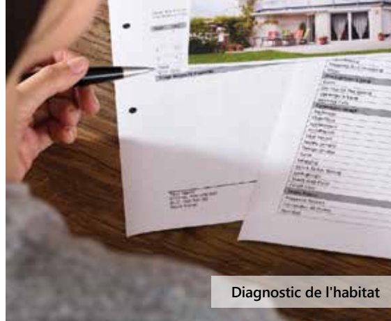
Diagnostic de l'habitat