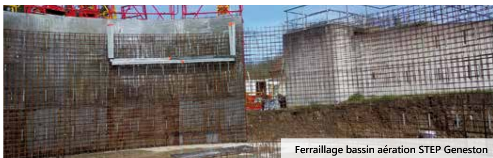
Ferrailage bassin aération STEP Geneston