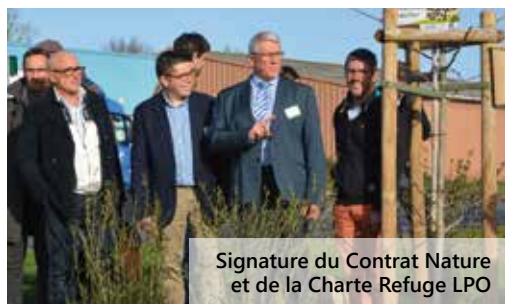
Signature du Contrat Nature et de la Charte Refuge LPO