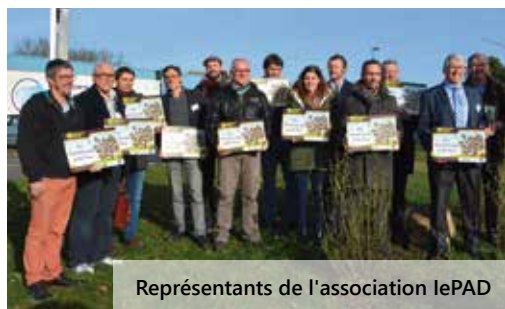
Représentants de l'association lePAD